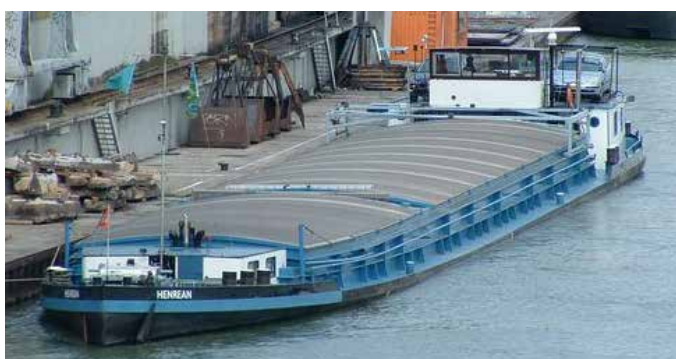
De Henrean over de volle lengte in augustus 2006. ■

De nestenschip en vang voor de neuringkettling zijn verwijderd en de opening voor de kettlingpijp is afgedekt met een plaatje.