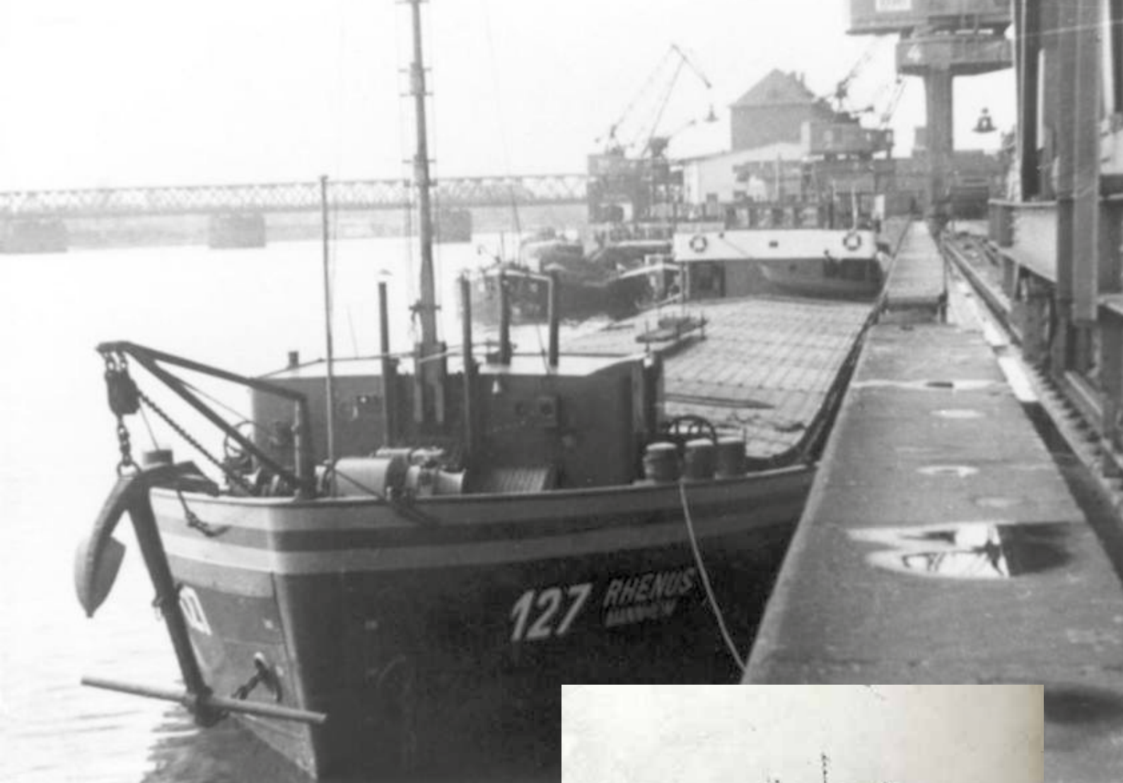
De Rhenus 127 Frankfurt.